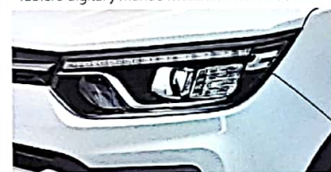
Faros HID con proyector y luces LED diurnas