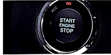
Encendido a botón