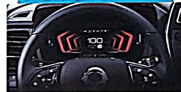
Tablero digital y mando multifunción en el volante