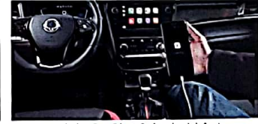
Apple Car Play & Android Auto