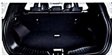
Amplio maletero de 427 litros